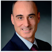
CHART INTERNATIONAL HOLDINGS, INC.